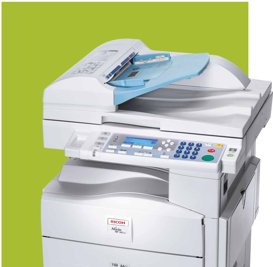
Aficio™ MP 161/MP 161L/MP 161LN

Prestazioni eccellenti e grande facilità d'uso